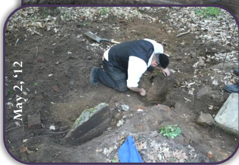
HFPJC agent discovering the matzeivas & foundation of the ohel