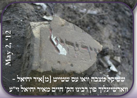
שטיקל מצבה וואו עס שטייט [מ]איר יחיאל - ווארשיינליך פון רבינו הק' חיים מאיר יחיאל זי"ע

נוסח מציבתה של הצדיקת המפורסמת לאה פערל בתו של רבינו הק' המגיד מ'קאזניץ זי"ע ... ...קדושתה וחסידתה.... בת אדו' מו' ור' רשכב"ה הרב האלוקי מו' ישראל זללה"ה מזגמיו"ש דק' קאזניץ נ' בש"ק ה' מרחשון תר"ט הצמח לנו ישיע לפ"ק