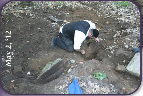
שלוחי אבותינו ביים טרעפן די מצבות און די יסודות פונעם אוהל ביה"ח מאגלניצע